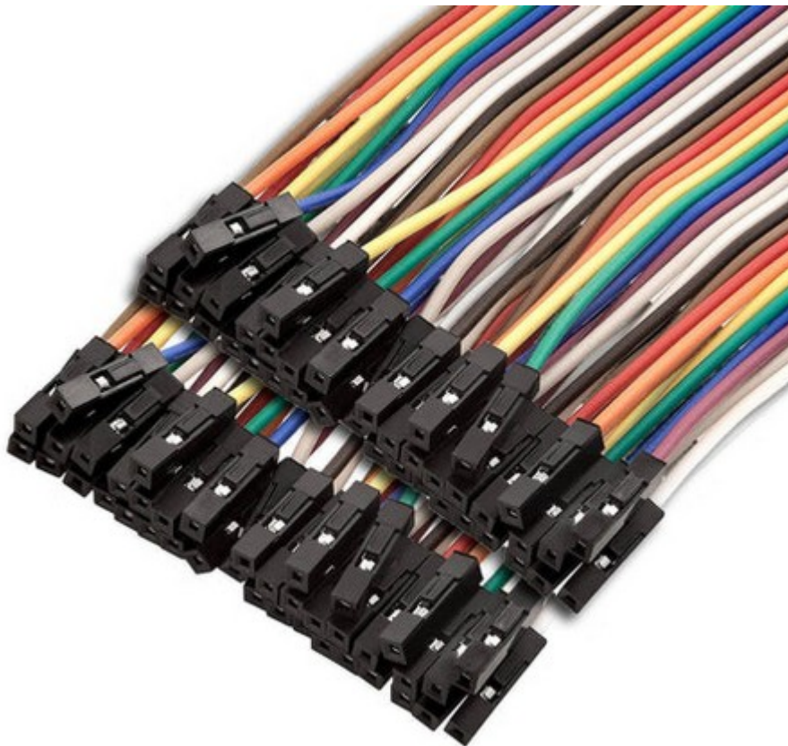
Arduino-Kabel (Buchse – Buchse) Arduino cable (female – female)